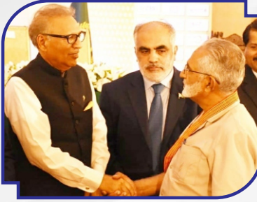
President of Pakistan Giving Best Rural Hospital Award