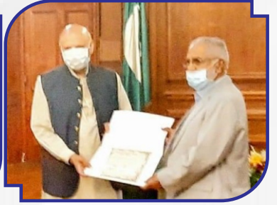
Governor Punjab Ch. Sarwar giving Covid 19 Best Services Award

آپ کی زکوٰۃ، لاکھوں زندگیوں کی ضمانت آئیے اس کارخیر میں ہمارا ساتھ دیں